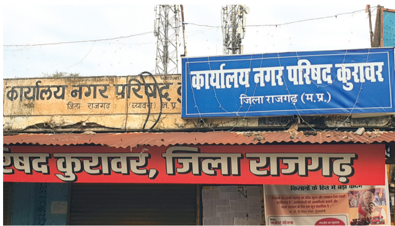
हरिभूमि न्यूज | ब्यावरा-कुरावर

विगत महीने इंद्रौर में दूषित पानी पीने से बीमार हुए लोगों की मौत की घटना के बाद से प्रदेश भर में पेयजल स्रोत की जांच की गई। इसी के चलते कुरावर नगर में स्थित विभिन्न जलस्रोतों की कार्यालय अनुविभागीय दण्डाधिकारी नरसिंहगढ़ के निर्देश पर नगर परिषद कुरावर द्वारा निकाय क्षेत्र के विभिन्न वाडों में स्थित शासकीय कुओं और निजी कुड़ियों के जल के नमूने लोक स्वास्थ्य यांत्रिकी पीएचई विभाग द्वारा जांचे गए। जांच रिपोर्ट में नगर के 6 जलस्रोत का पानी पीने योग्य नहीं पाया गया है। नगर में करीब 30 हजार की आबादी है तथा नगर में 15 वाडों के निवासी पेयजल के लिए निजी जलस्रोत का उपयोग वर्षों से करते चले आ रहे हैं।