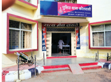
ब्यावरा