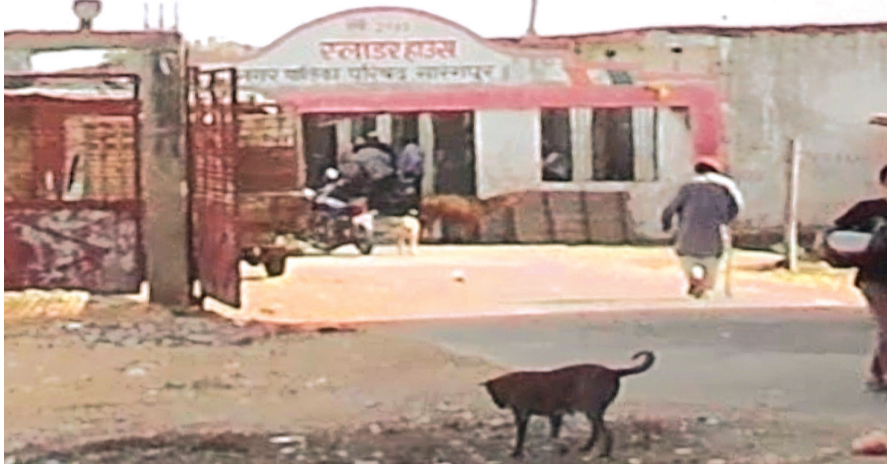
हरिभूमि न्यूज | सारंगपुर

प्रदेश की राजधानी भोपाल में हाल ही में बड़े स्तर पर गो मांस जब्त की कार्रवाई के बाद भी स्थानीय प्रशासन की उदासीनता सामने आ रही है। सारंगपुर नगर में संचालित स्लॉटर हाउस बिना किसी वैध लाइसेंस के खुलेआम पशु वध का कार्य कर रहे हैं, जो भी विगत दो वर्षों से लेकिन जिम्मेदार अधिकारी इस गंभीर मामले से पूरी तरह बेफिक्र नजर आ रहे हैं। जानकारी के अनुसार सारंगपुर में वर्तमान में दो स्लॉटर हाउस संचालित हैं, जिनमें नगर पालिका परिषद अथवा सक्षम विभाग से कोई वैध अनुमति या लाइसेंस नहीं लिया गया है। इसके